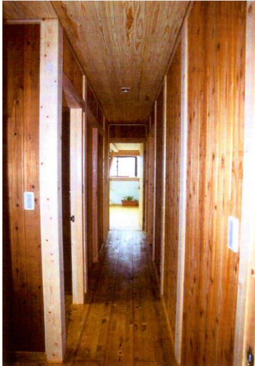
◇廊下の壁も木材の現わしに。