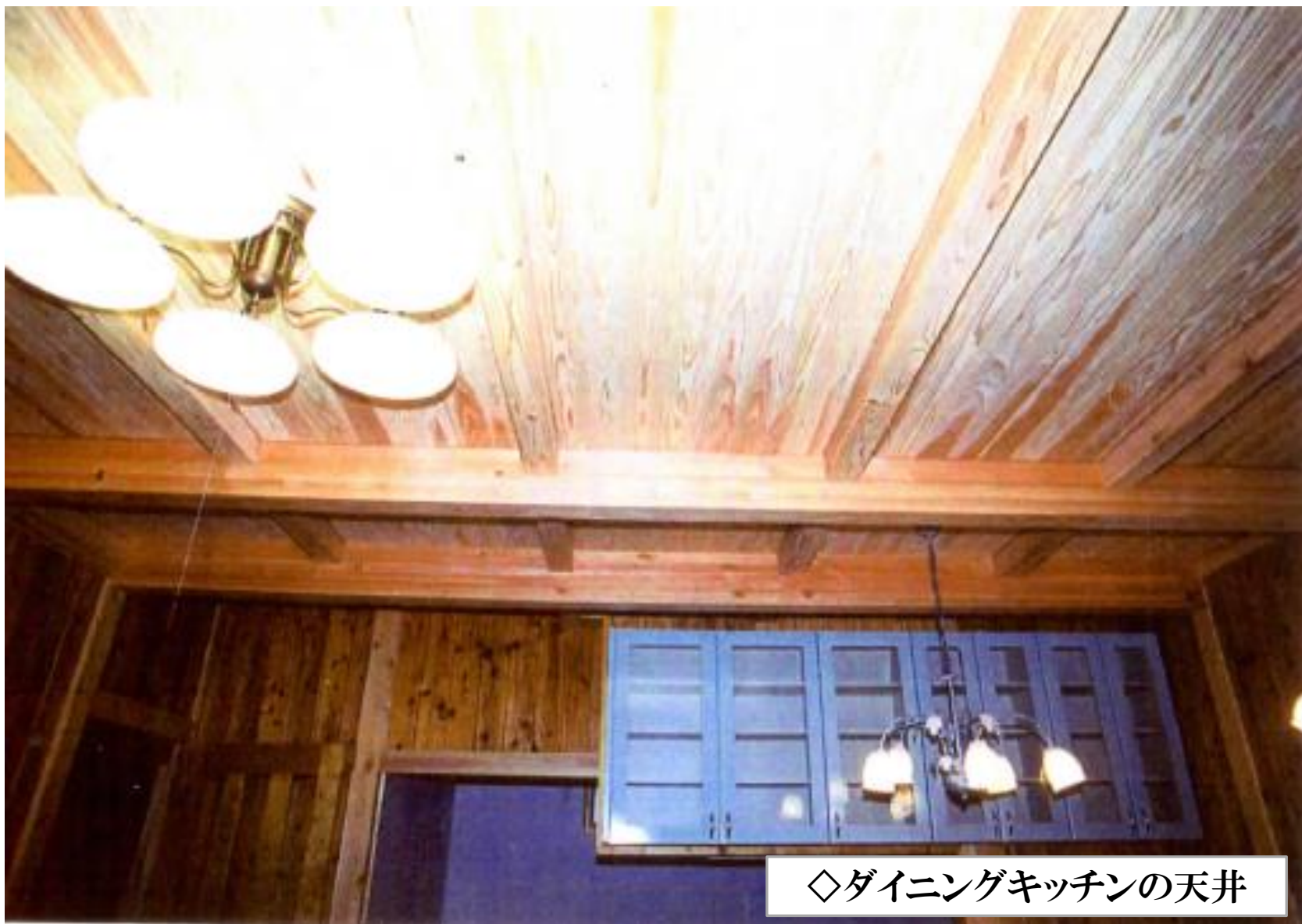
◇ダイニングキッチンの天井