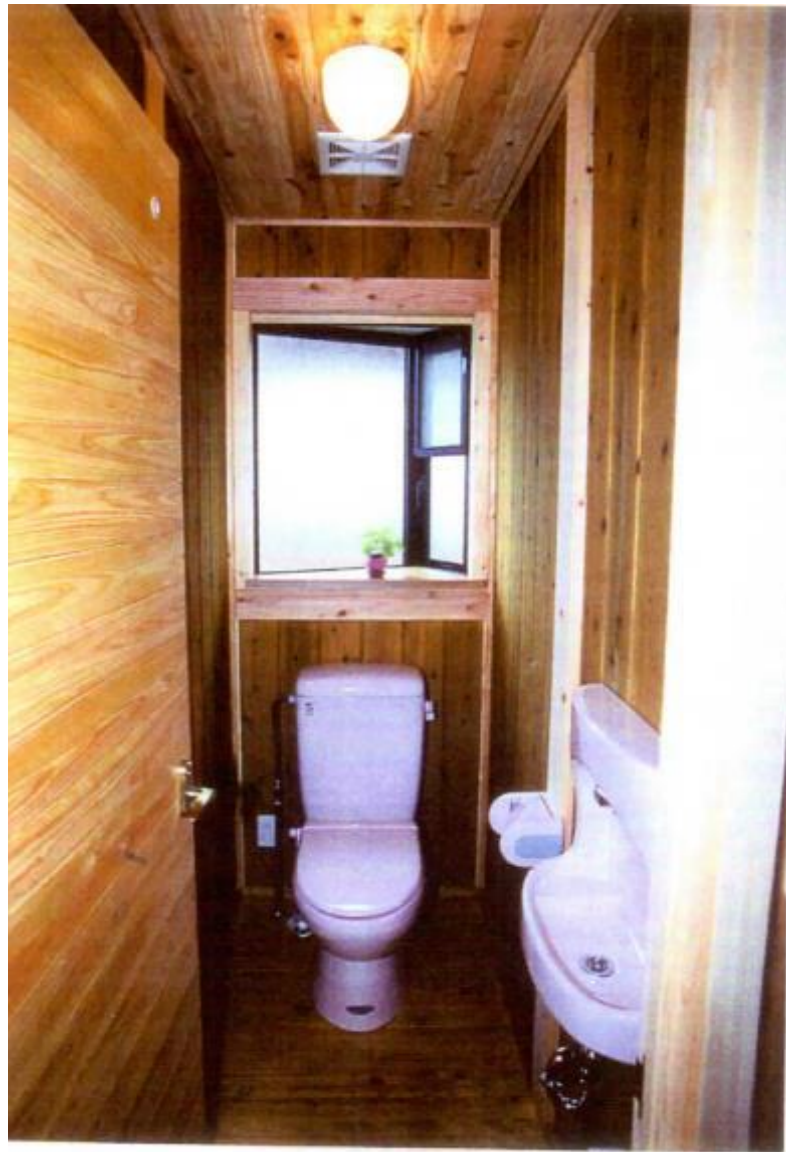
◇トイレの壁も現しに。