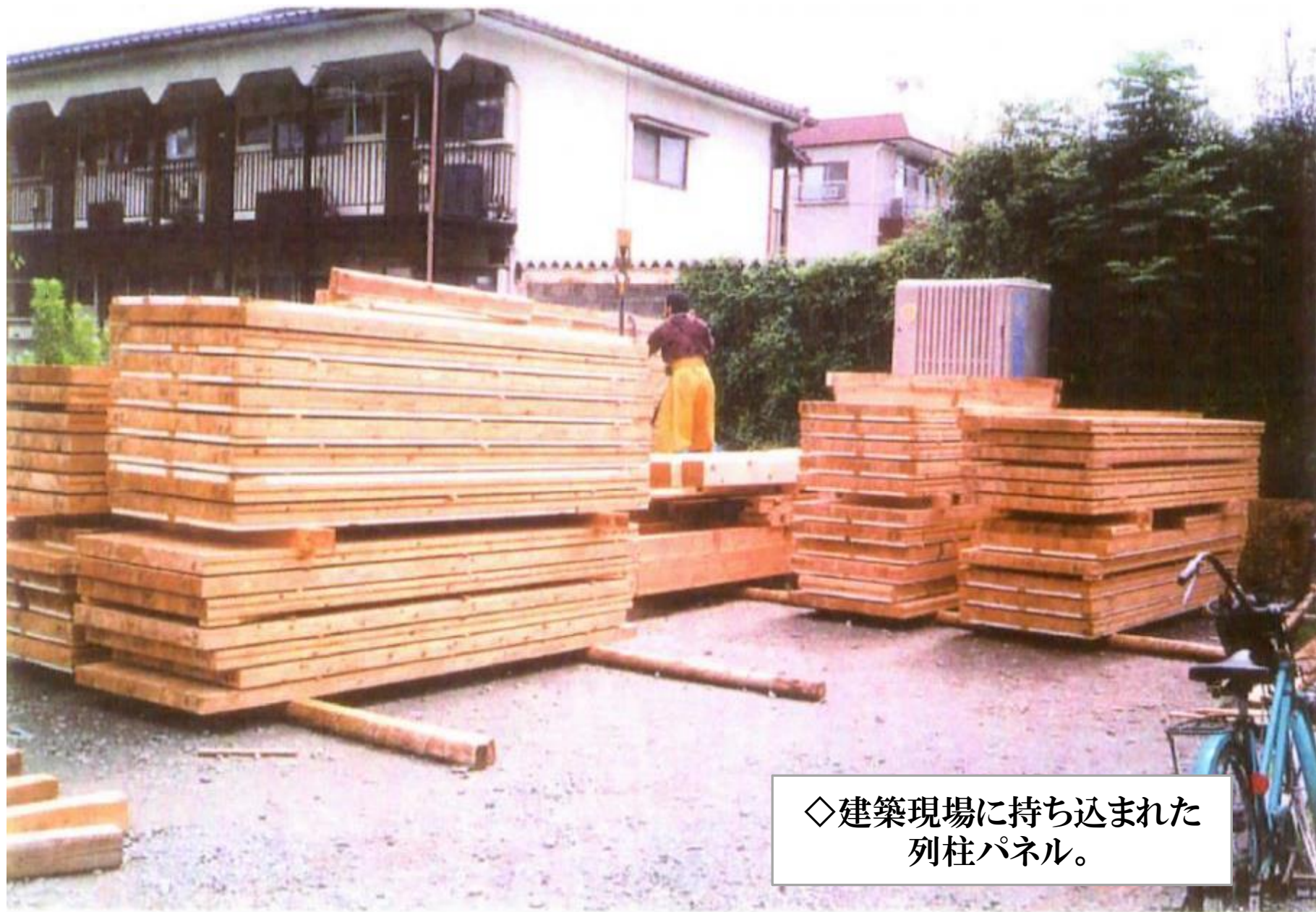
◇建築現場に持ち込まれた 列柱パネル。